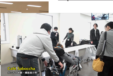
Café Saboccha ポッチャの体験・機器展示等