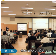
第1部 全体会シンポジウム

https://futurecreating.net/conference/conference-5381/